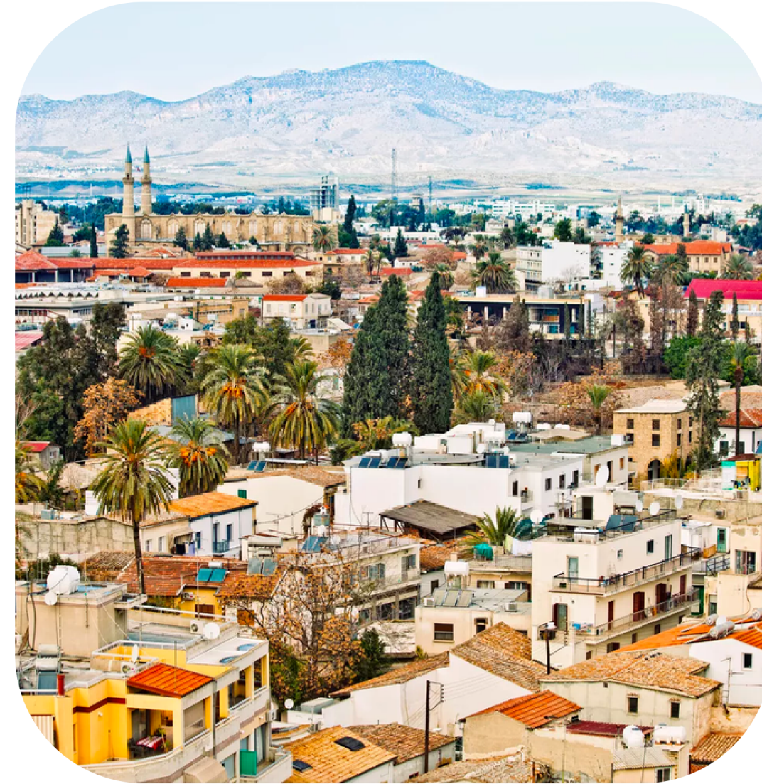
Gennaio 2023 Larnaca, Cyprus